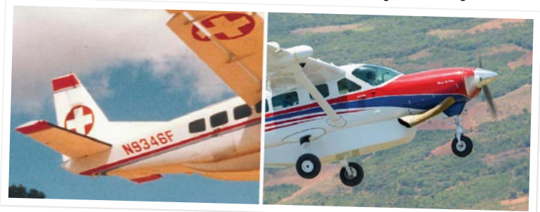
A gauche, le S/N 018 est peint en livrée d'ambulance pendant la guerre civile angolaise, et à droite, le S/N 018 portant la livrée moderne actuelle.

Comme j'ai récemment terminé la mise à jour de toutes les cartes de références des pistes d'aviation pour notre équipe en Angola, j'ai une meilleure idée du "tout-terrain" que cet avion a fait. Beaucoup de pistes d'atterrissages en terre et en herbe seulement d'environ 1000m de longueur. Imaginez utiliser votre véhicule pour conduire sur